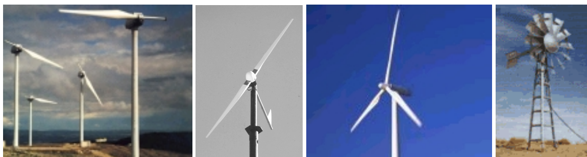
Figura 5.7 – Diversos tipos de turbina-eólicas, com número de pás variável

A maioria das turbinas eólicas tem 3 pás. No entanto, ao contrário do que pode parecer intuitivamente, o mais importante não é o número de pás, mas sim a superfície varrida por estas. Assim, uma turbina eólica com apenas 2 pás pode ter a mesma eficiência que uma turbina eólica de 3 pás. Existem também turbinas eólicas com uma só pá. Este modelo está a ser construído por uma empresa italiana (Riva Galzoni), encontrando-se esta tecnologia ainda em fase de desenvolvimento (ver figura 5.7).