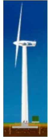
Figura 5.1

O vento é definido essencialmente por dois parâmetros: velocidade e direcção . A sua intensidade não é regular e a sua disponibilidade depende do local. Como tal, antes de cada instalação, medições dos parâmetros do vento têm que ser efectuadas, assim como um estudo do relevo do local. Quanto menores forem as alterações do relevo, menores serão as barreiras físicas e assim melhor será a regularidade do vento. Esta é a razão pela qual, hoje em dia se estão a desenvolver parques eólicos em “off-shore”.