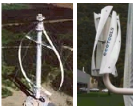
Figura 5.6 – Eólica vertical de Cap-Chat - Canadá (esq.) e eólica vertical “Rosa dos Ventos” (dir.)

Hoje em dia, poucas empresas fabricam turbinas eólicas de eixo vertical. No entanto, o exemplo mais famoso talvez seja o da turbina eólica de Cap-Chat do Canadá (ver figura 5.6). A grande vantagem deste tipo de turbina eólica é o facto de o gerador se encontrar na base e de poder captar os ventos sem necessidade de um mecanismo de orientação.